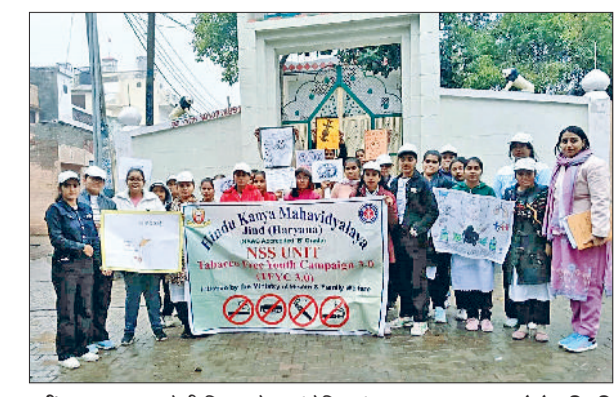
जीद। जागरूकता रैली निकालते स्वयंसेविकाएं।

कुत्ते पार्क में घुसे रहते हैं। पशु बच्चों व बुजुर्गों को भारकर चोटिल कर सकते हैं। इस कारण लोगों को पार्क में जाते समय डर लगा रहता है। हाउसिंग बोर्ड के पार्क की दीवार के निर्माण की मांग को लेकर लोग नगर परिषद से कई बार मांग कर चुके हैं। अगर वह निर्माण बन जाते हैं तो लोगों को काफी फायदा होगा। कम से कम बेसहारा गोवंश पार्क में नहीं घुस पाएंगे।