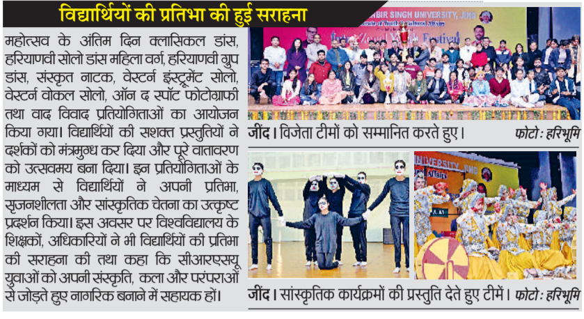
विद्यार्थियों की प्रतिभा को हुई सराहना महोत्सव के अंतिम दिन क्लासिकल डांस, हरियाणवी सोलो डांस महिला वर्ग, हरियाणवी ग्रुप डांस, संस्कृत नाटक, वेस्टर्न इंस्ट्रुमेंट सोलो, वेस्टर्न वोकल सोलो, ऑन द स्पॉट फोटोग्राफी तथा वाद विवाद प्रतियोगिताओं का आयोजन किया गया। विद्यार्थियों की सशक्त प्रस्तुतियों ने दर्शकों को मंत्रमुग्ध कर दिया और पूरे वातावरण को उत्सवमय बना दिया। इन प्रतियोगिताओं के माध्यम से विद्यार्थियों ने अपनी प्रतिभा, सृजनशीलता और सांस्कृतिक चेतना का उत्कृष्ट प्रदर्शन किया। इस अवसर पर विश्वविद्यालय के शिक्षकों, अधिकारियों ने भी विद्यार्थियों की प्रतिभा की सराहना की तथा कहा कि सीआरएसयू युवाओं को अपनी संस्कृति, कला और परंपराओं से जोड़ते हुए नागरिक बनाने में सहायक हैं।