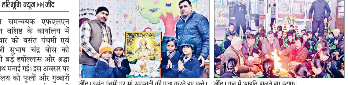
जींद। बसंत पंचमी पर मां सरस्वती की पूजा करते हुए बच्चे।