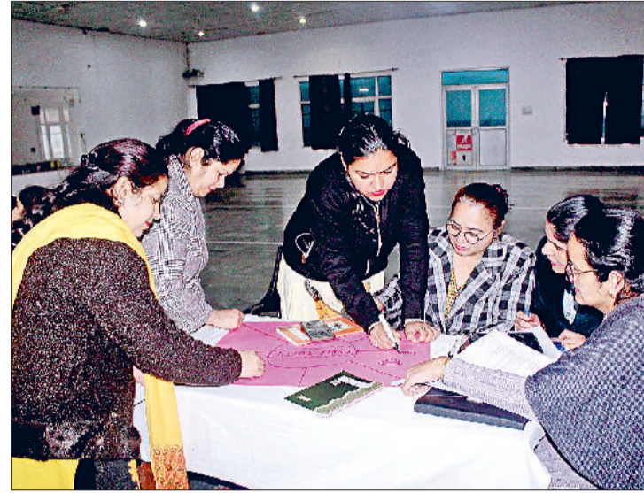
जीद। कार्यक्रम में भाग लेते हुए अध्यापिकाएं।