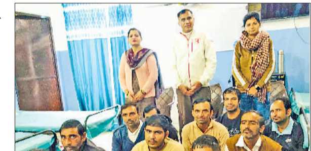
जीद। नशा छोड़ने के लिए जागरूक करते हुए।