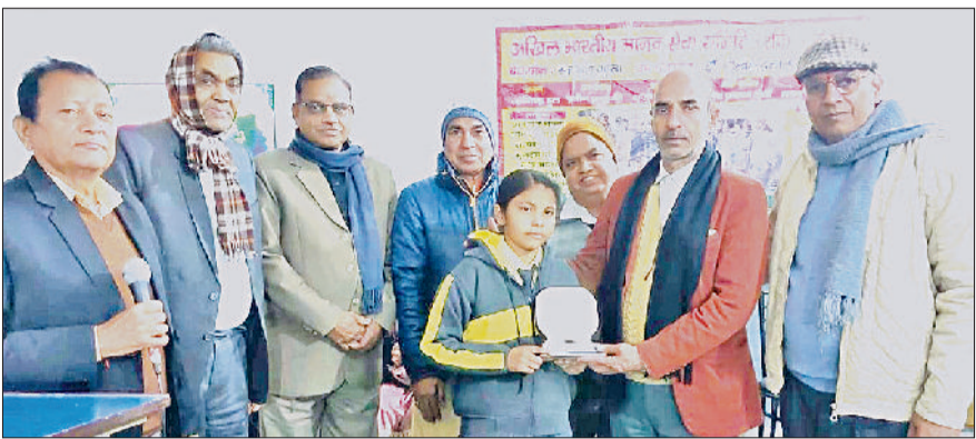
कैथल। अव्वल रहे विद्यार्थियों को सम्मानित करते पदाधिकारी